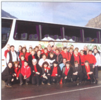
Auch eine Delegation des AlpPan-Fanclubs reiste an den Fuss des Matterhorns.